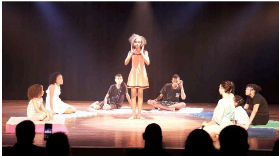
11 février 2023 : restitution publique de « R-Encontros », Espace Culturel Boca de Brasa Cajazeiras, Salvador.

Affiche d'annonce de la 1 e soirée de restitution des jeunes + présentation de la conférence performée de Fanny Vignals. Graphisme ©Alexandre San Goes, Fondation Pierre Verger.