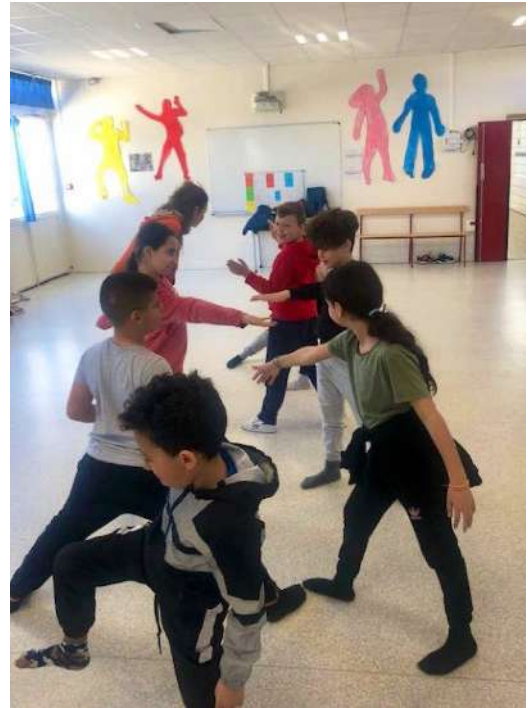
Atelier autour de l'espace qui se trouve autour du corps de l'autre : comment créer des formes avec cet espace sans toucher l'autre.