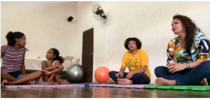
Première intervention des professionnelles du CEDECA-Bahia auprès des jeunes participant à « R·Encontros ».