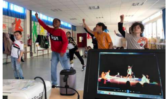
Apprentissage des danses individuelles des enfants et jeunes du Brésil