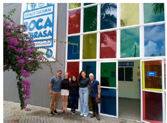
Visite technique des lieux de représentation avec l'équipe de l'ECL et le directeur des Espaces Culturels Boca de Brasa.