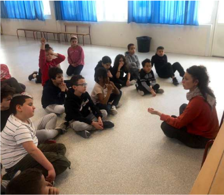
23 mars 2023 : premier atelier à Gennevilliers après de retour du Brésil de la chorégraphe. Échange autour de l'expérience au Brésil.