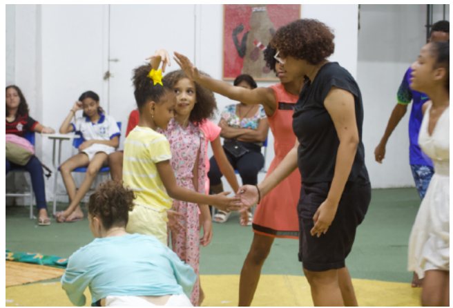
9 février 2023 : restitution publique de « R-Encontros », Espace Culturel de la F. P. Verger.

Affiche d'annonce de la 1 e soirée de restitution des jeunes + présentation de la conférence performée de Fanny Vignals. Graphisme ©Alexandre San Goes, Fondation Pierre Verger.