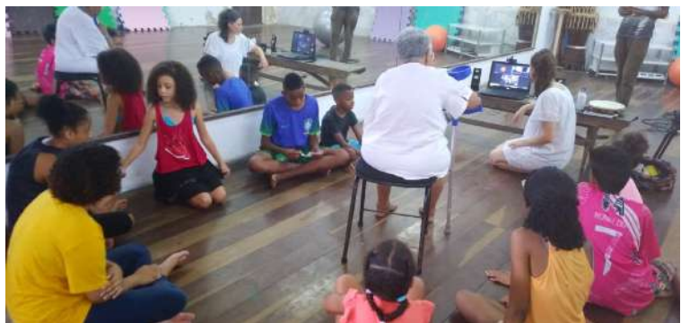
Visioconférence avec les classes de CE2-CM1 de l'École Anatole France de Gennevilliers : échanges, présentation de danses individuelles et interventions de la conteuse Dona Egbomi Cici.