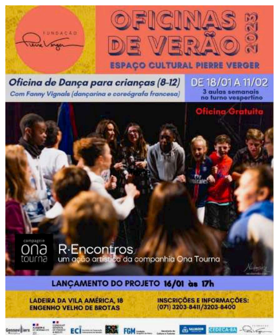
Affiche d'appel à participation au projet. Graphisme ©Alexandre San Goes, Fondation Pierre Verger.