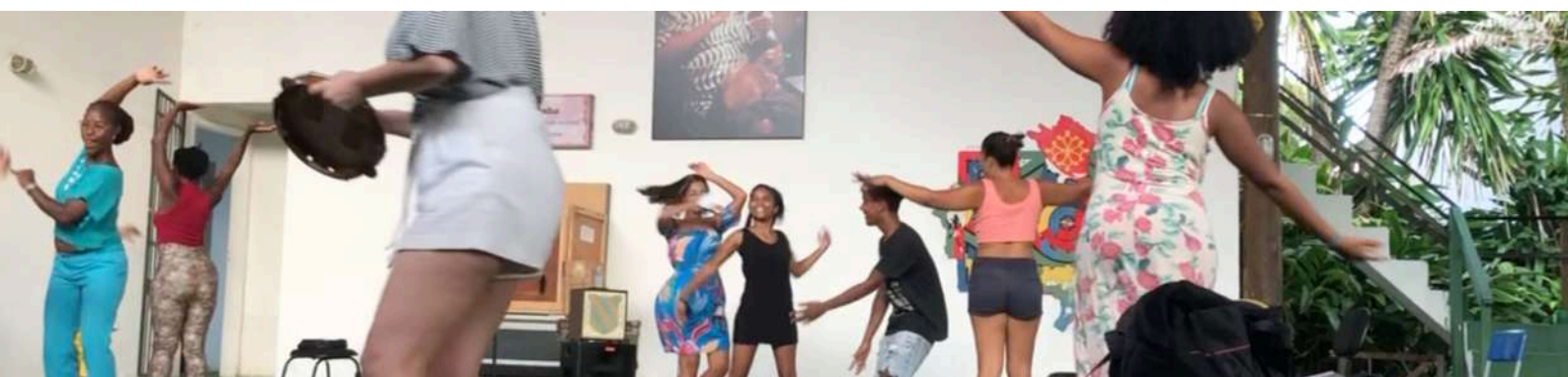
Atelier participatif avec le public lors du lancement du premier volet, le 16 janvier 2023 à l'Espace Culturel de la Fondation Pierre Verger, Salvador de Bahia

Les ateliers de danse constituent le coeur de R·Encontros . Ils sont nourris d'interventions de professionnel·les locales·aux et incluent des visioconférences entre les groupes et la réalisation de vignettes-vidéos par lesquelles chaque enfant transmet sa danse à un enfant de l'autre pays. Enfin, dans le but de sensibiliser les participant·es à la notion d'oeuvre artistique, le projet est finalisée par une ou deux restitutions publiques, et les participant·es assiste à un spectacle de la compagnie.