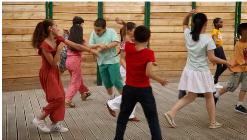
16 juin 2023, spectacle de restitution des ateliers de R·Encontros par les enfants gennevillois. Image ©Diana Gandara