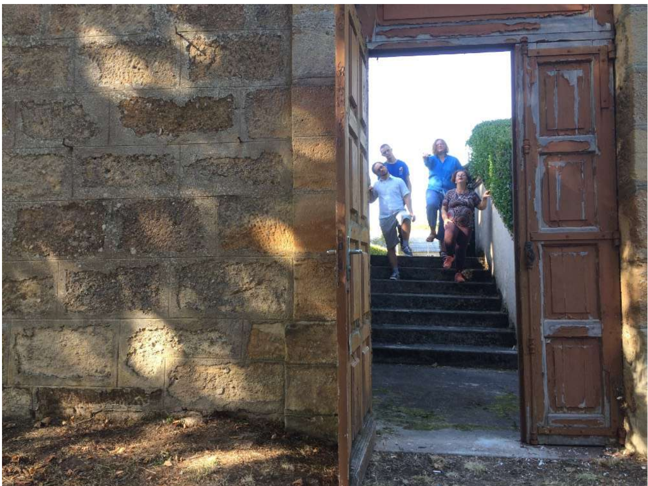
Danseur·se·s de La Passerelle - Leyme, septembre 2019