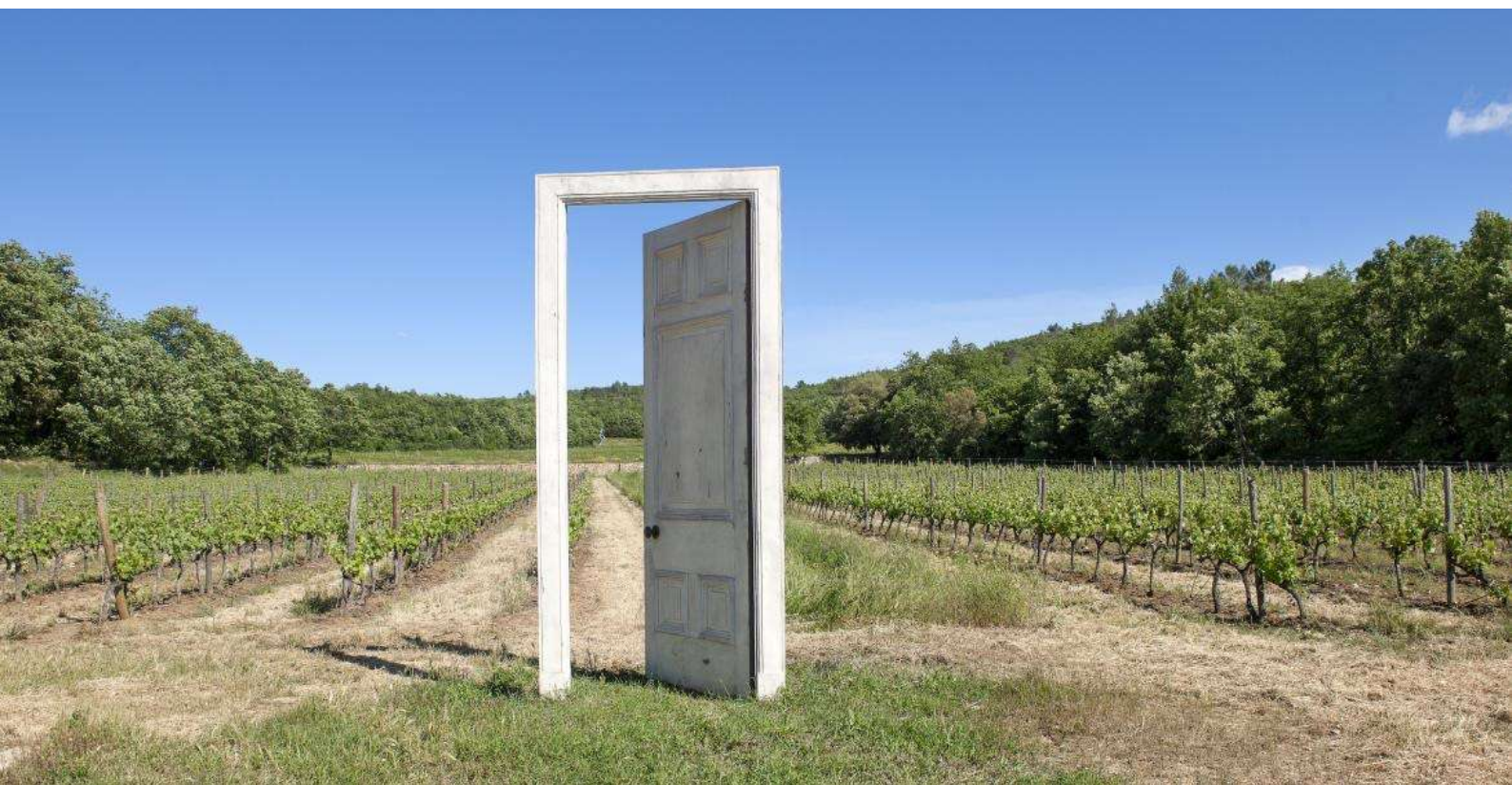
La porte de Gavin Turk